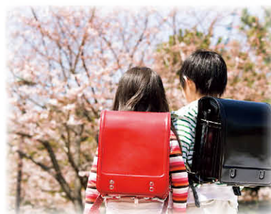
一人親家庭応援 新入学児童ランドセル 購入助成事業9名申込 (上限1万5千円)

工玩具など、子どもたちが楽しめる遊具等を贈りました。 コロナ禍でも、人のつながりが途切れないように支え合おうというみなさまのお気持ち が、今年度の歳末たすけあい運動につながりました。 運動にご協力をいただいた自治会関係者や民生委員・児童委員のみなさま、そして募金をいただいたみなさまに感謝いたします。 (事務局次長 春名 豊滋)