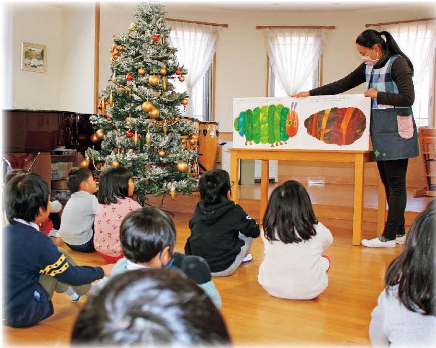
見ごたえ十分!大型絵本「はらぺこあおむし」を楽しむみのり保育園の園児 市内の保育園やこども園等(24か所)へ遊具等を贈りました

コロナ禍の長期化を受けて、全ての人が不安を感じながらの生活が続きますが、地域のみなさまのあたたかいご理解とご協力をいただき、歳末たすけあい運動を実施しました。お寄せいただいた募金は、必要な方へあたたかい支援を届けて欲しいという、みなさまの歳末たすけあい運動への期待の表れだと思えます。 こんな時だからこそ、笑顔になれるような取り組みや思いやりの大切さをあらためて感じました。 たくさんのご協力ありがとうございました。