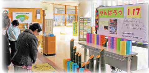
(やすらぎ福祉センター)