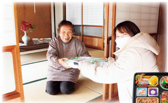
歳末特別給食サービス275名の方へ (利用料500円)

多くの方にご賛同いただいた募金は、宍粟市共同募金委員会から本会へ配分を受け、地域で年末年始をあたたくく迎えられるようにと、75歳以上のひとり暮らし世帯へのたすけあいサービスなどの財源として活用しました。 また、今年度はコロナ感染拡大防止を踏まえ、プロの劇団による人形劇の鑑賞を中止し、市内の保育園やこども園等に幼児向けの大型絵本や木