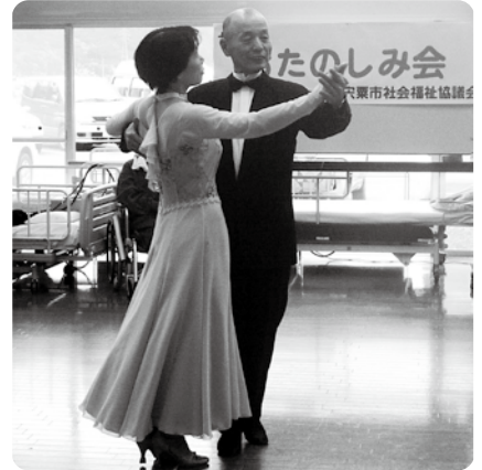
施設訪問の風景「やすらぎ介護センター」のデサービスにて