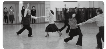
「クイック・クイック・スロー」練習の風景