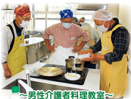
～男性介護者料理教室～

参加者から ・ 毎日のことやで簡単な物がええ。さつま芋ご飯はできそうや。 ・ 話せてよかった。来てよかった。