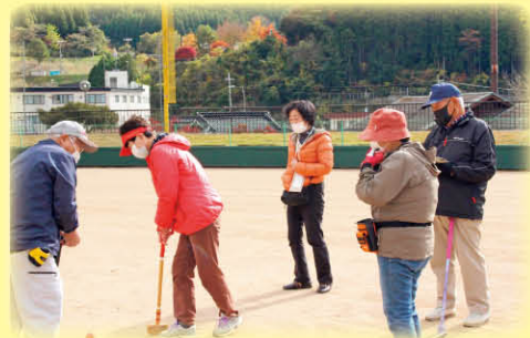
「初めてしたけど楽しいわ」