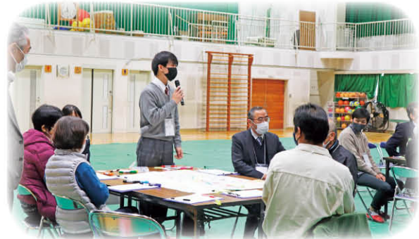
千種のこれからを“自分ごと”として

このシリーズでは、住民のだれもが「ふだんのくらしのしあわせ(ふくし)」を実現できる地域づくりをめざした取り組みを紹介します。