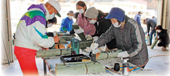
やすらぎ福祉センター(一宮町閨賀)

「阪神淡路大震災1.17のつどい」で使用される竹灯ろうづくりを行いました。「ぶるーべりい会」の協力のもと竹林から伐り出した竹を加工し、一本一本に想いを込めて文字を入れました。約210本の竹灯ろうが完成。参加された役員からは「今年はまだみなさまとお会いし、活動が出来てよかった」と語られました。