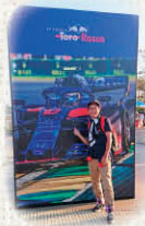
鈴鹿サーキット(三重県)