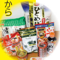
「思いやりセット」のイメージ

穴粟市社会福祉協議会では、市民や企業、団体のみなさまから善意銀行に寄付いただいたお米や缶詰などの食材を「 思いやりセット 」として必要とする方へ無料で配布しています。