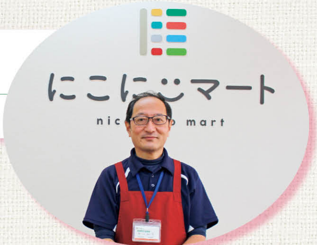
にこにこマートは旧Aコープ波賀店隣の空き店舗を改装した住民有志で運営するスーパー