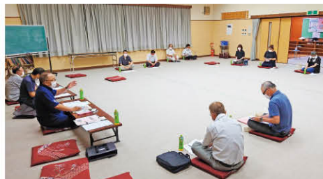
青木福祉連絡会の様子(7/3)

今年度もコロナ禍で活動が困難な中、“今できること”を工夫して市内の147自治会から申請がありました。地域の安心や元気につながる“福祉でまちづくり”にご活用ください!