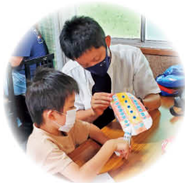
親子の絆が深まります ペーパークラフト教室