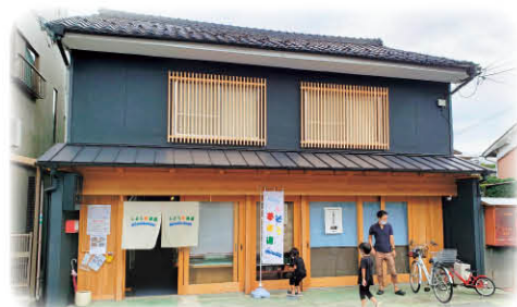
8/13にオープンした鉄道模型ジオラマ交流館

開館時間:土・日・祝日 10時～17時 入館料:400円(中学生以上) 200円(小学生以下) 3歳未満無料 ※子どものみ入館不可。 走行券:1,000円(90分) ※原則車両持ち込み 問合せ:0790-71-2525(交流館) 山崎町山崎207番地1(宍粟市商工会付近)