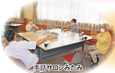
手話サロンみたま