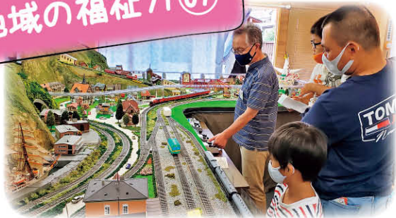
完成した電車がレールの上を走り大喜び！ 持ち込みの鉄道模型を走らせることもできます