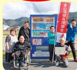
あおぞら太陽福祉会