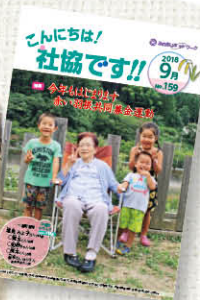
4年前の2018年9月号。子どもたちは、小5、小3、小1になりました