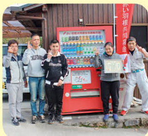
ワークプラザすぎの木

兵庫県共同募金会より「募金付き自動販売機の設置」に長年ご協力いただいた団体に表彰状が贈呈されましたのでご紹介します。(敬称略)