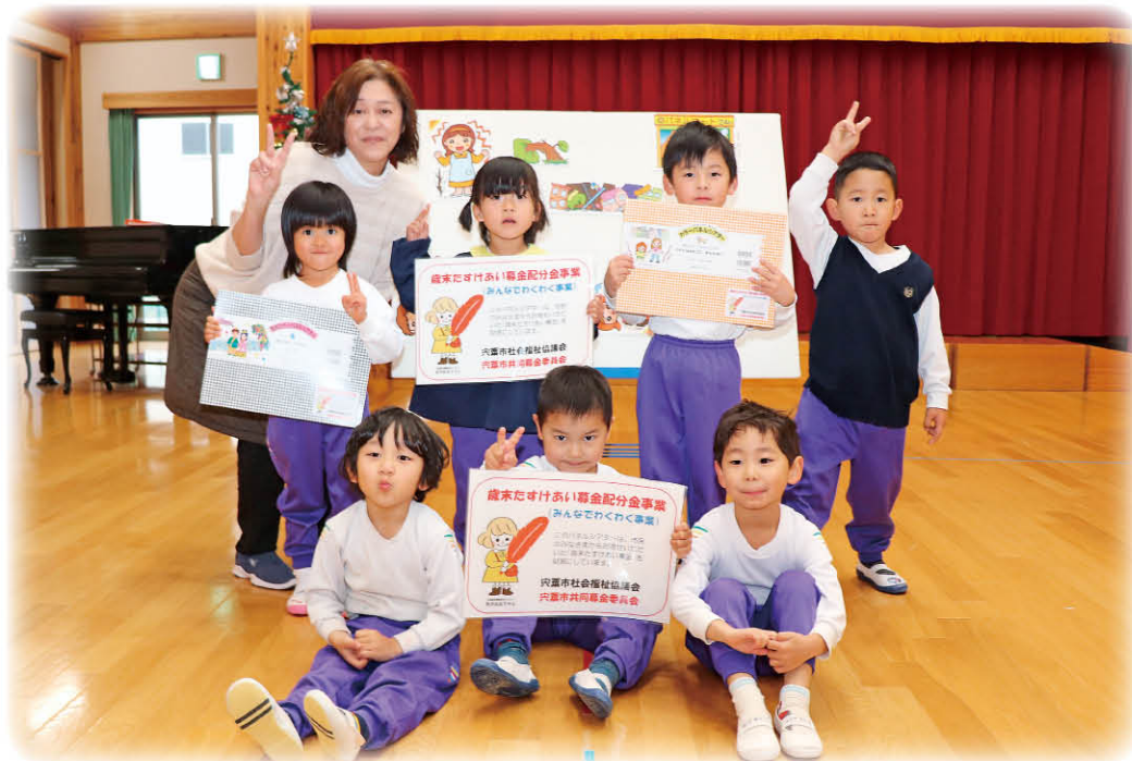
歳末募金を活用し、宍粟市内の幼稚園や保育園等に大型絵本を届けます。また、新しい取り組みとして各園等を会場にプロの演奏会を実施します（写真：R3ちくさ杉の子こども園）

この運動の趣旨をご理解いただき、みなさまのあたたかい気持ちをお寄せいただきますようお願いいたします。