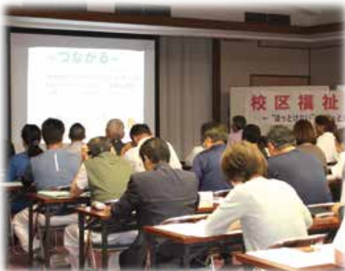
令和8年度校区福祉連絡会 (R8.5月下旬から6月上旬)

福祉委員のみなさまが中心となって、地域の「見守り・支え合い活動」が進められています。この度自治会長と代表福祉委員を対象に、校区福祉連絡会を開催し、福祉委員の役割をはじめ、小地域福祉活動助成「赤い羽根見守り応援助成事業」について説明させていただきました。