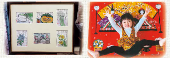
素敵なお絵手紙とひ孫ちゃんへ送った「雛飾り」もちろん手作りです!

河野 人間、嫌いなことは覚えへんでね。好きやから時間を忘れて夢中になれるし、この年までこんな風に好きなことができるもの、感謝しないとね。今と違って学ぶことが難しかった時代やったから、みんな苦労したんや。けどこうして続けられる「好きなこと」に出会ってほんまに幸せなんや。