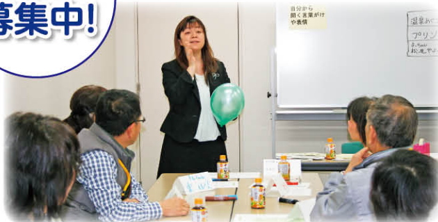
平成 25 年度「傾聴ボランティア講座」の様子