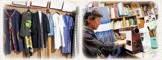
亡きご主人と一緒に買いに行ったミシンは今でも現役!

河野 その昔に高校生だったころに文化学院から先生が来てくれて「和裁」を教えてくれたんや。本当は若い頃は美容師になりたかったんやけど、和裁を教えて貰って洋裁も知って、こんなに楽しいことがあるんや!って楽しくなったんや。