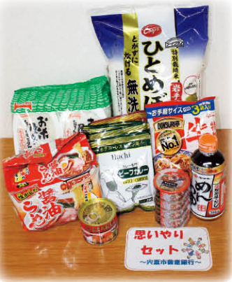
購入した缶詰やレトルト食品などを、「思いやりセット」として困窮者世帯へ支援します

いただいています。この善意（預託金・物品）は、誰もが安心して暮らせる地域づくりやボランティア活動、当事者支援活動の推進、また大規模災害発生時の支援等に大きな役割を果たしています。