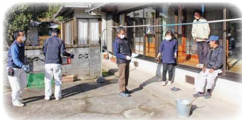
1件1件みんなで訪問…「どないしよってや」