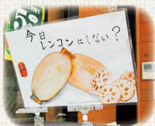
見とれてしまうほどの腕前!