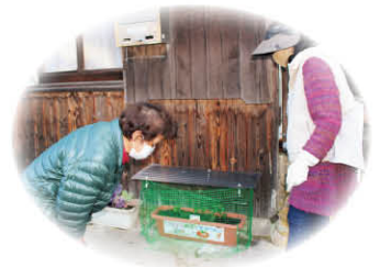
プランターは鹿対策ネット付き