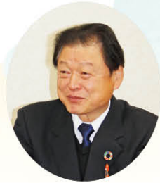
宍粟市社会福祉協議会