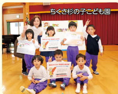
ちくさ杉の子こども園

今年もみんなで集まって人形劇の鑑賞ができないことから、市内の幼稚園、保育園・所、こども園、各町子育て支援センターに幼児向け大型絵本、パネルシアター、ヒノキ製木工玩具「キャリアカー」の3点から選んで頂いたものを贈りました。