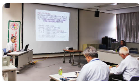
助成審査会の様子

6月15日(月)一宮保健福祉センターで審査を行い、今年度の助成団体を決定しました。