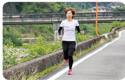
9月京都で行われるウルトラマラソン(60km) 出場を目指して仕事終わりに、練習