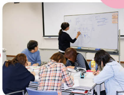
昨年度、研修会の様子