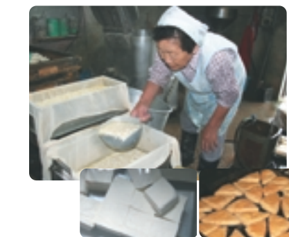
出来たて「豆腐」とボリューム満点「油あげ」は最高です。朝6時から豆腐作りがはじまります