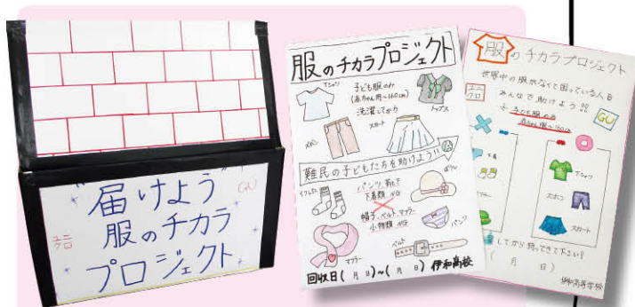
作成したチラシと回収ボックスは、一宮北中、一宮南中、波賀中に設置しています