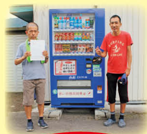
宍粟福祉会さつき園