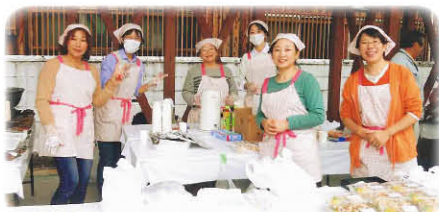
ふれあいフェスタでの「七目まぜご飯」栄養満点で250食以上作ったそうです