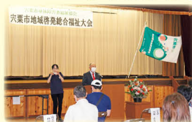
2年ぶりの開催に笑顔笑顔の会場でした

令和3年度 総会を開催! 宍粟市身体障害者福祉協会 7月11日(日)、市民センター波賀で、宍粟市身体障害者福祉協会「宍粟市地域啓発総合福祉大会(総会)」並びに「宍粟市身体障害者スポーツ大会」が開催され、感染対策に取り組み、32人の会員が交流を深めました。