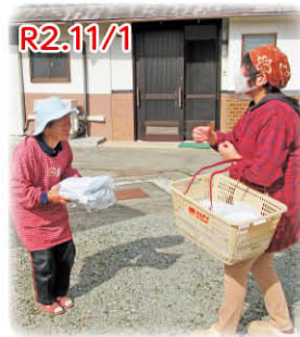
お弁当の配達を通じて、見守りや話し相手に

飯見自治会では、小地域福祉活動助成金で感染予防備品を購入し、毎月1回見守り活動を行い、訪問後には『地域見守り会議』を開催し、地域の困りごとを情報共有されています。