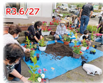
久しぶりの再会に自然と笑顔が

水谷自治会では、屋外で短時間でもできることをと考えると、公民館で寄せ植えをされました。