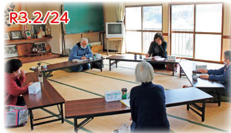
見守り会議の様子。ゴミ出し等、ちょっとした困りごとのお手伝い(ご近所ボランティア)もされています

6月20日に兵庫県の緊急事態宣言が解除され、各自治会で福祉連絡会を中心に取り組む小地域福祉活動が少しずつ再開されています。 今月号では、「新しい生活様式」を基に、感染予防を徹底しながら“コロナ禍でも今できること”を工夫して取り組まれている活動を紹介します。 ぜひ、今後の参考にしてください。