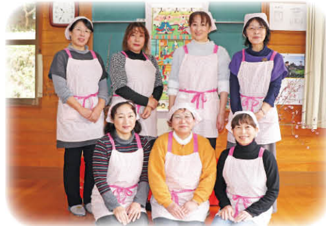
「七野」からなのの会のネーミングを!

このシリーズでは、住民のだれもが「ふだんのくらしのしあわせ(ふくし)」を実現できる地域づくりをめざした取り組みを紹介します。