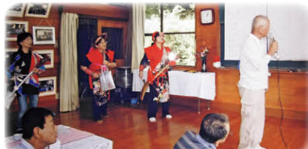
スコープ三味線演奏に合わせてリズムカルに♪～令和元年度敬老祝賀会～