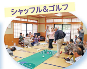
シャッフル&ゴルフ