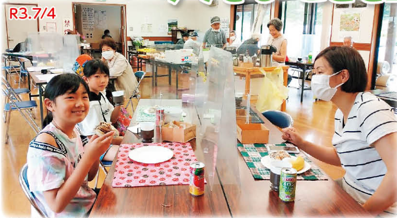
上野田自治会のふれあい喫茶 しっかり距離を取り社協貸出備品の飛沫防止パーテーションを活用

6月20日に兵庫県の緊急事態宣言が解除され、各自治会で福祉連絡会を中心に取り組む小地域福祉活動が少しずつ再開されています。 今月号では、「新しい生活様式」を基に、感染予防を徹底しながら“コロナ禍でも今できること”を工夫して取り組まれている活動を紹介します。 ぜひ、今後の参考にしてください。