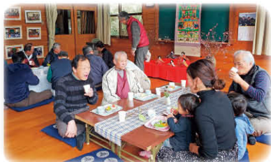
ふれあい喫茶を“桃の節句”に合わせて～H31.3.3～

千種町七野自治会を中心 ひつ に活動されているボランティア「なのの会」を紹介します。今年で結成9年目、町の食生活改善委員会で出会った3～4人のメンバーが「ふれあい喫茶っていうものを聞いたんやけど、うちでもやってみようか」という話から、なのの会の活動が始まったそうです。