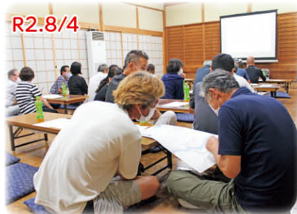
西公文自治会では、「防災学習会」を開催し自主防災マップで危険個所を確認

地域の困りごとや心配ことは、コロナ禍でも変わりません。 西公文自治会や谷自治会では、社協の『ふくしの出前講座』を利用して大切な地域の学びの場を開催されました。