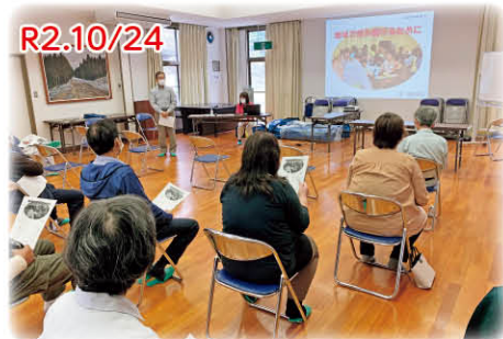
谷自治会では、「認知症について」理解を深め地域で住み続けるために向こう三軒両隣(近助)の大切さについて学習