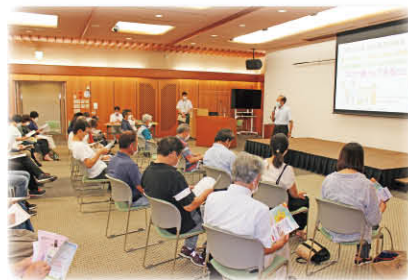
市内の4会場で開催 (栄栗防災センター)