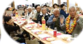
みんなが主役の ふれあいの場