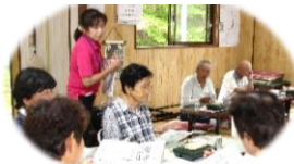
私たちが地域づくりの専門職