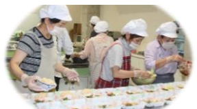
手作りお弁当で 暮らしをサポート