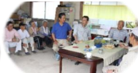
地域の中で気軽に 寄れる集いの場