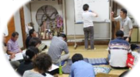
自治会福祉連絡会